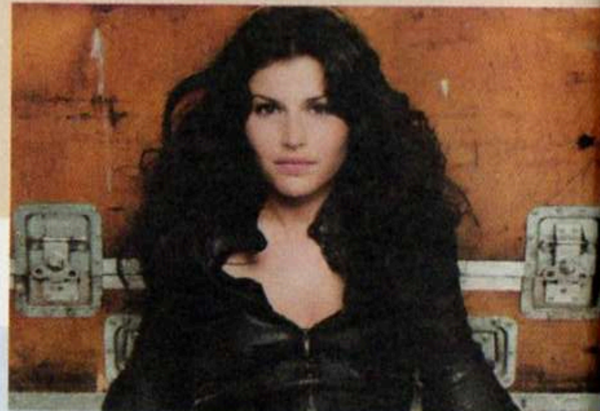
Giusy Ferreri; a sinistra Renato Zero